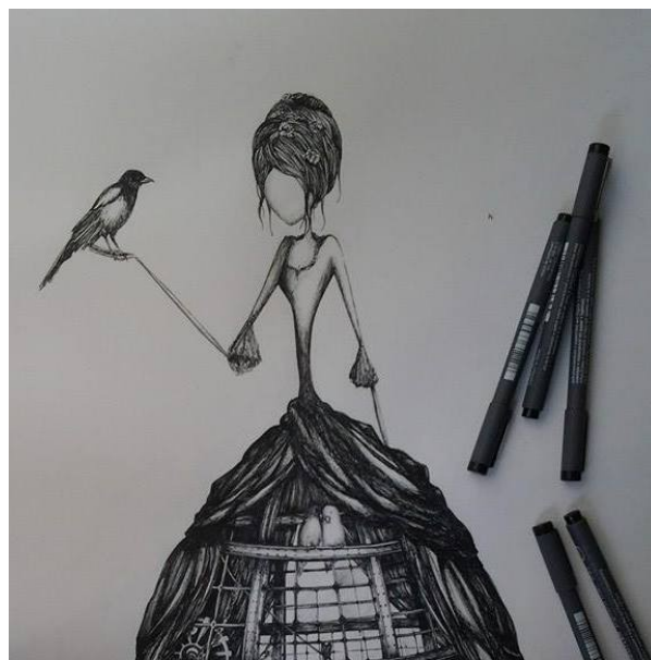
Sibylle Dodinot Sibylledodinot.com